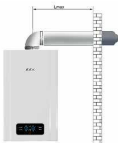
Горизонтальная система дымоудаления

(Lmax с одним коленом: 4 м, (Ø60/100) (Lmax с одним коленом: 6 м, (Ø80/125)