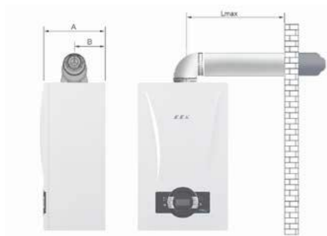
Горизонтальный коаксиальный дымоход Максимальная длина L макс.: 10 м, Ø60/100 Максимальная длина L макс.: 20 м, Ø80/125